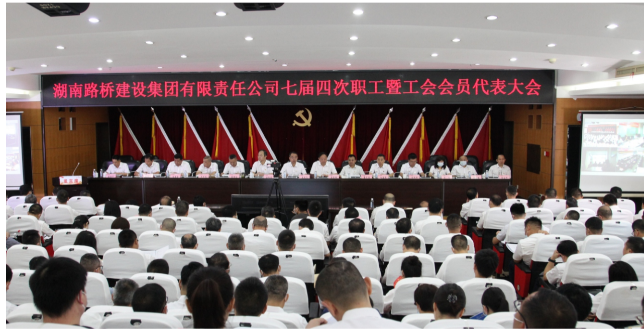
湖南路桥建设集团有限责任公司七届四次职工暨工会会员代表大会